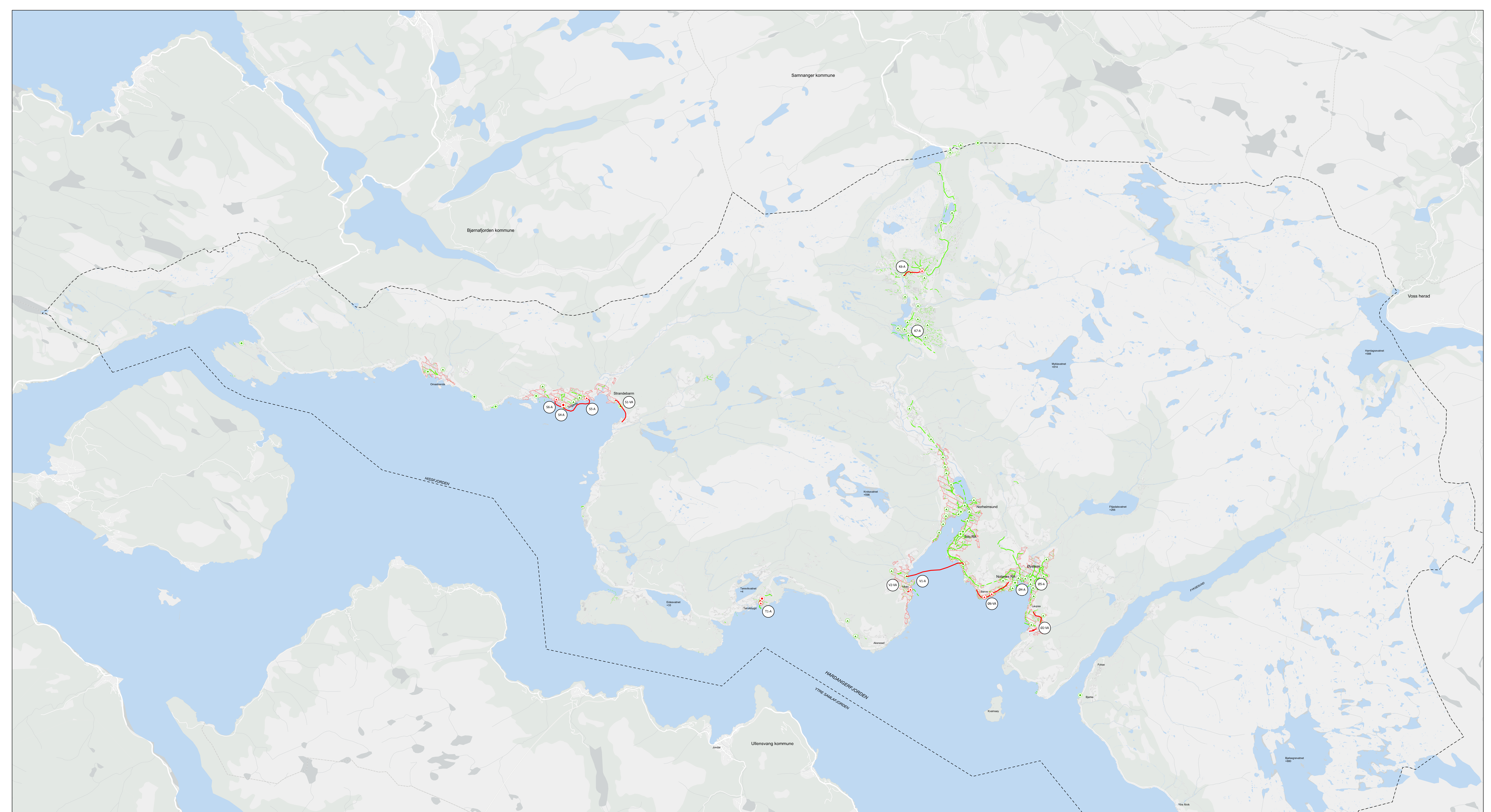
Vedlegg 1 – Kart med oversikt over avløpstiltak

OPPDRAGSGIVAR KVAM HERAD KOMMUNE PROSJEKT KDP VATN OG AVLØP Målestokk A0 1: 45 000 Utført Marte Holmeseth Kontrollert Andreas Sviland Godkjent Jan Ove Vindenes Dato 2026-02-20