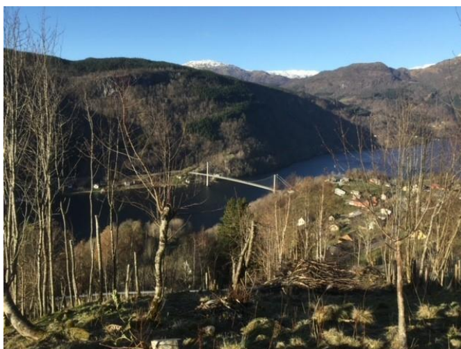
Beiterydding på våren på Fykse.

Sats: Opptil 50 % av godkjend kostnadsoverslag.