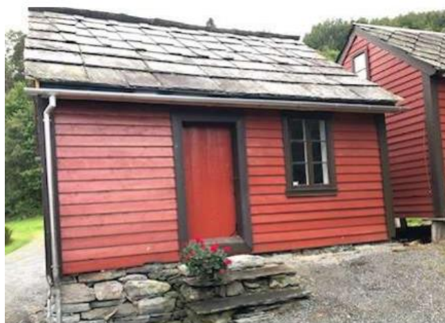
Nyrestaurert skytje i tun i Strandebarm. Tiltaket har i tillegg til SMIL midlar, fått tilskot frå Norsk kulturminnefond og Norsk kulturarv.

Sats: Maksimalt 40 % av godkjend budsjett.