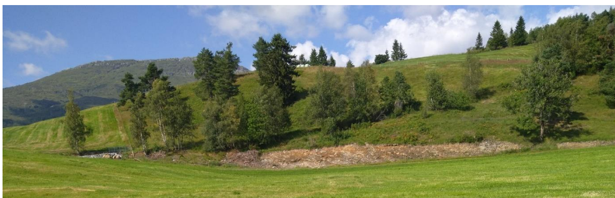
Føretaket her har fått SMIL-støtte til HT gjerde og skjøtsel av beite då ein nabo gav seg med dyr. Støtta sikra vidare beiting og skjøtsel av eit stort samanhengande beite. Beite er nærliggande til turområde på Kjosås.

Færre bønder og nedlagte bruk gjev meir grovfôrareal per verksemd og husdyra er meir konsentrert i områder. Spesielt er det redusert beitetrykk på innmark og i utmark som er utfordringa med tilvekst av skog og gjerder som forfell. Særeigne bratte kulturbeite med styvetrer, steingardar, svingete traktorvegar, kisteveiter og eldre frukttre er under press av gjengroing, og har trøng for vedlikehald og restaurering. Det er viktig at me fortsett å prioritera restaurering av kulturbeite med god økonomisk kompensasjon.