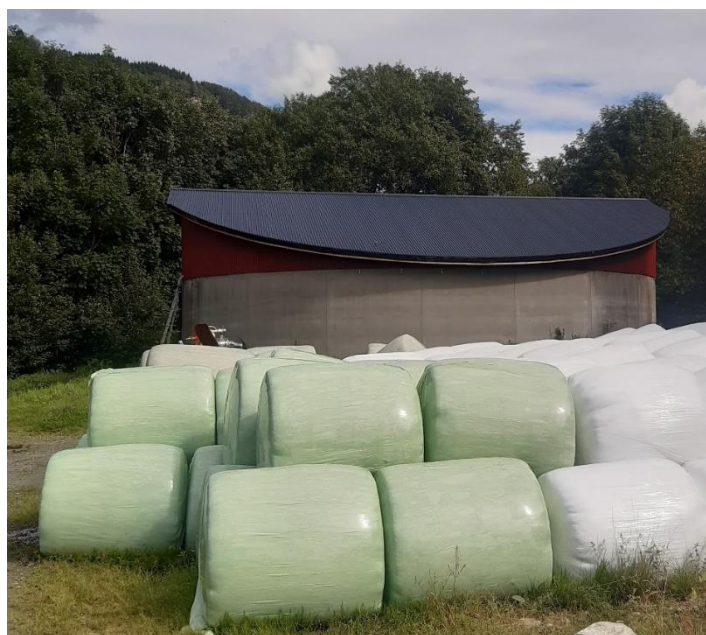
Føretaket her har fått SMIL tilskot til å byggje tak på gjødselkumme.

Etablering av dekke over gjødsellager dempar utslepp til luft og aukar lagerkapasiteten for husdyrgjødsel. Det er og vanleg å låne gjødselkjellar på nedlagte bruk. Om gjødselporten vert vedlikehalden og toler belastninga kan dette vera ei god løysing. Alle tiltak som vil avgrense næringsssalta frå å renne ut i vassdrag og forureining til luft kan få SMIL tilskot. Me kan nemne