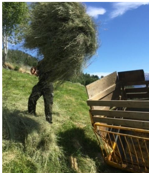
Bilete frå Fykse der mykje av arealet vert hausta og slått med tohjulsslåmaskin og ryddesag.

Krav: Området skal merkast i kart. Arealet skal slåast minst ein gong i året i tillegg til beiting. Sats: Opptil 50 % av maksimalt 2000 kr per dekar.