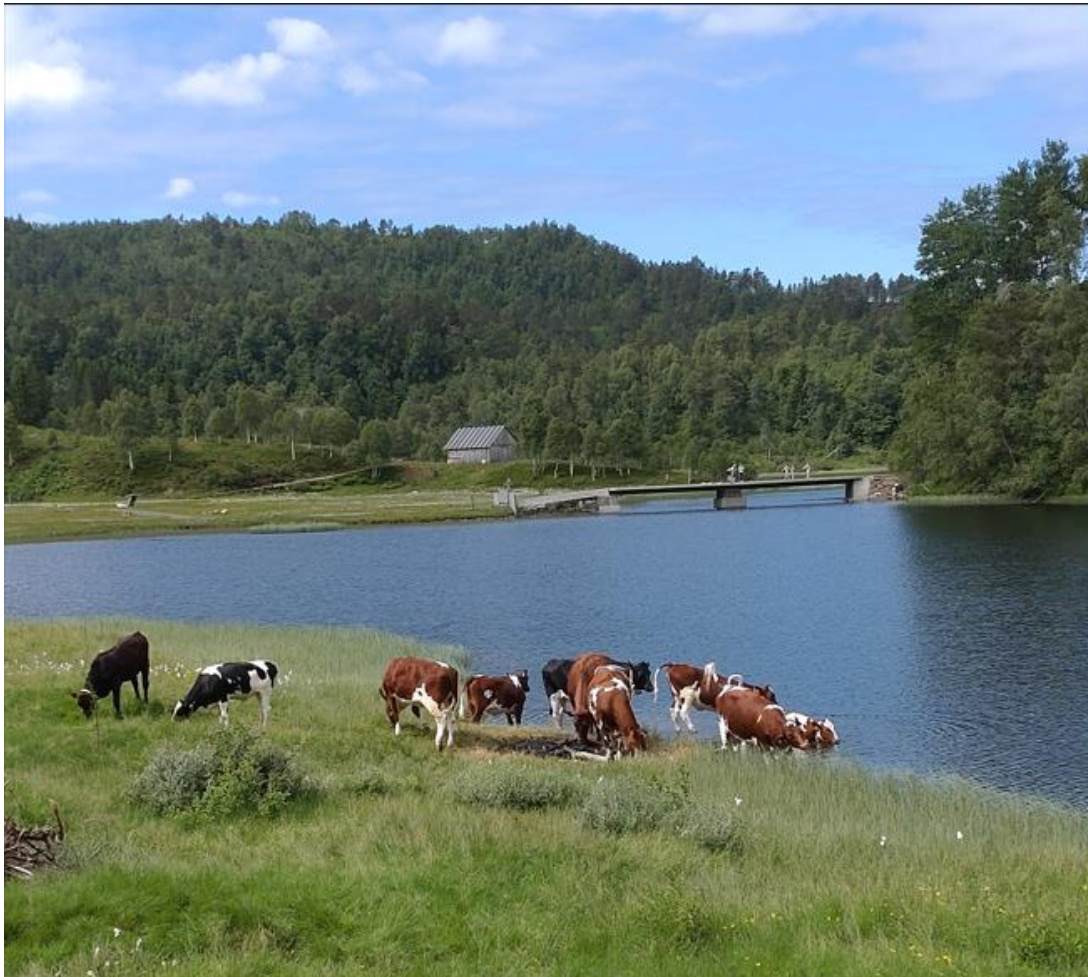
Ny bru ved Longvotno i 2021. Fellestiltak mellom grunneigarane. Brua vert nytta til transport av dyr til beitemark på Kvamskogen. Brua vert mykje nytta til turføremål og grunneigarane tilrettela for bading, den vert og nytta til å trekke skiløype over på vinteren.

SMIL (Spesielle miljøtiltak i landbruket) er tilskot til tiltak utover det som kan forventast gjennom vanleg jordbruksdrift. Det er tiltak som fremjar natur- og kulturverdiane i kulturlandskapet og redusera forureining frå jordbruket.