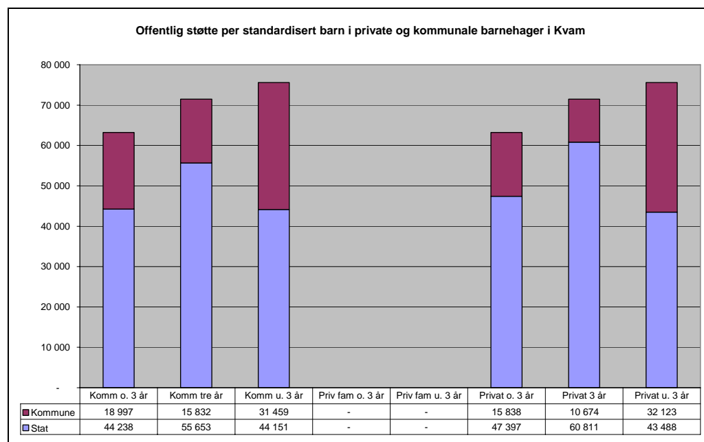
Figur 3.2: Tilskudd til private og kommunale barnehager i Kvam, modellberegning.

Det er meget sannsynlig at Trygge barnehager vil legge seg på et lavere kostnadsnivå enn det kommunale. Barnehagen har lavere bemanningsnormer enn de kommunale, og det er lønnskostnadene som er de største kostnadene. Et sannsynlig budsjett for barnehagen er satt opp i figuren nedenfor. Den ender opp med et underskudd på 1,3 millioner kroner, som altså er kommunens ansvar å finansiere.